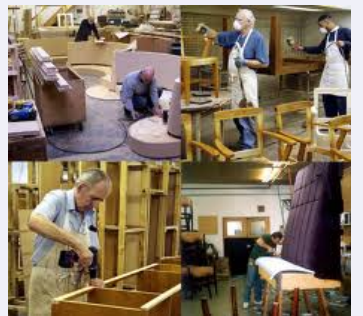
මූලාශ්‍රය - වාර්ෂික කර්මාන්ත සමීක්ෂණය - 2009